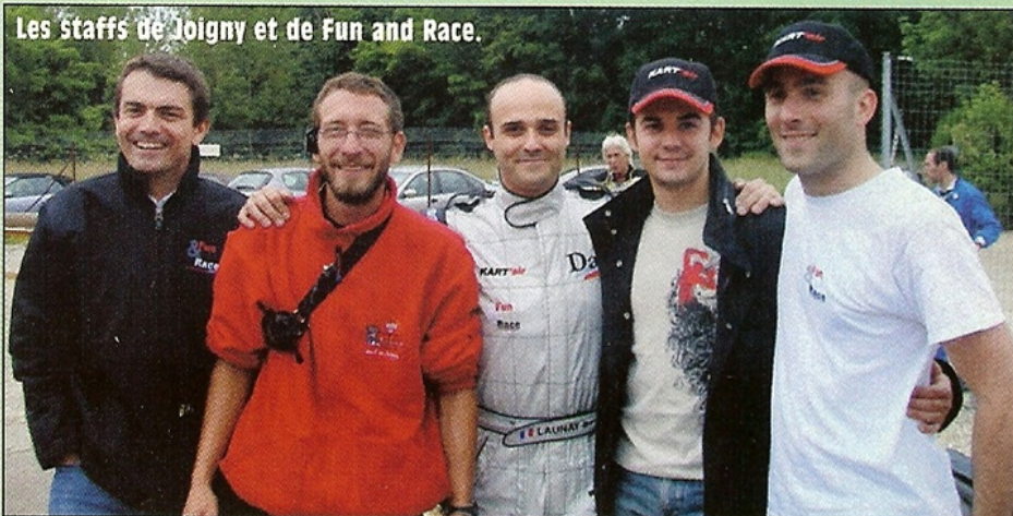
Les Staffs de Joigny et de Fun and Race.